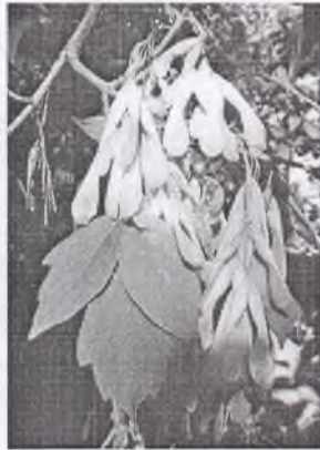
д) клёна сенелистный, или американский