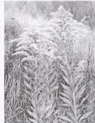
е) золотарник канадский

Этот вид не распространяется самосеменами; вытесняет мест. виды