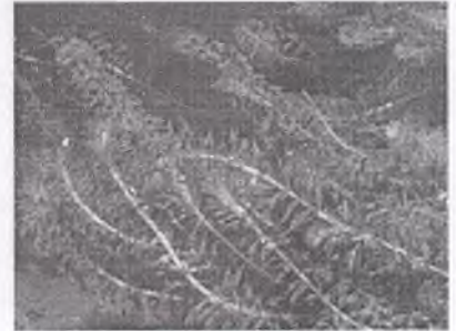
в) элодея канадская