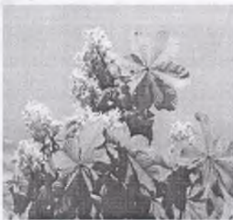
г) конский каштан обыкновенный